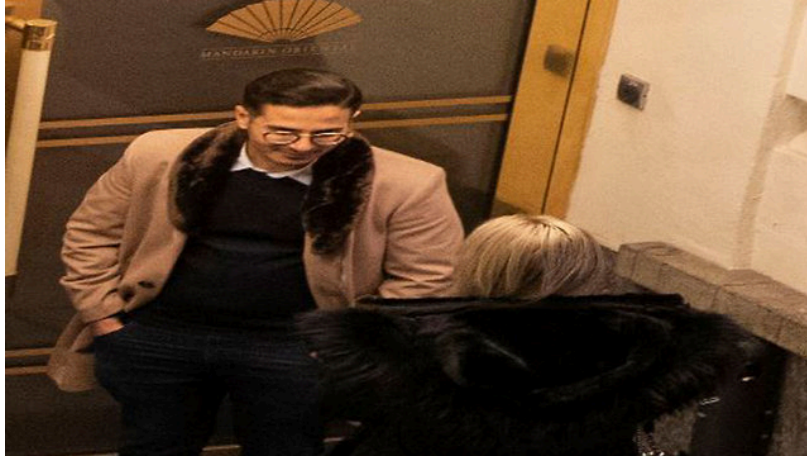
תיעוד של אחת הפגישות, מתוך התחקיר